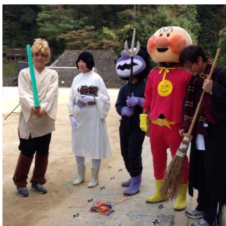
大阪府立富田林支援学校 ミニ運動会